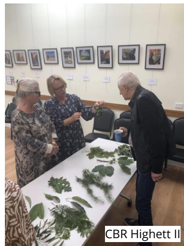
Cbr Highett II