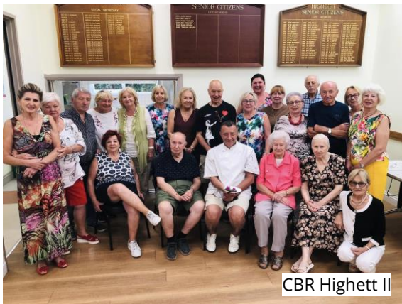
CBR Highett II