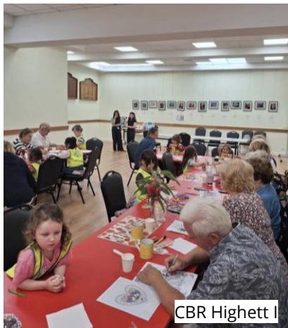
CBR Highett I