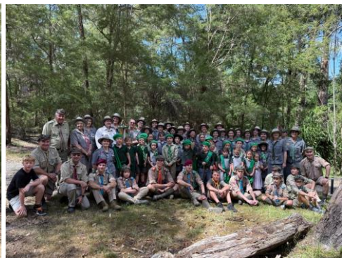
Fot. 1 – Uczestnicy obozu w Brisbane. Fot. 2 – Kadra i osoby funkcyjne po warsztatach na „Polanie”. Fot. 3 – Hufiec Podhale na otwarciu roku harcerskiego na „Polanie”.