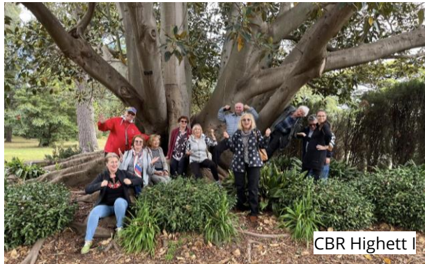
Cbr Highett I