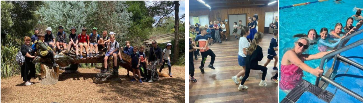
Fot. 1 – wycieczka do Healesville Sanctuary. Fot. 2 – Warsztaty taneczne z Zespołem „Łowicz”. Fot 3 – wycieczka do parku wodnego Funfields

Zgodnie z wieloletnią tradycją Związek Polaków w Melbourne zorganizował w okresie letnio-wakacyjnym kolonie i obóz w Ośrodku Młodzieżowym „Polana”. Na pierwszym turnusie gościliśmy młodzież w wieku 13-17 lat, na drugim turnusie bawiły się dzieci w wieku 8-12 lat. Z każdym rokiem nasza oferta wakacyjna cieszy się coraz większą popularnością wśród dzieci i młodzieży. W tym roku gościliśmy na „Polanie” 82 uczestników.