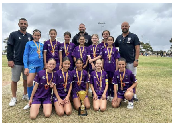
Zawodniczki Keilor Park SC z trenerami