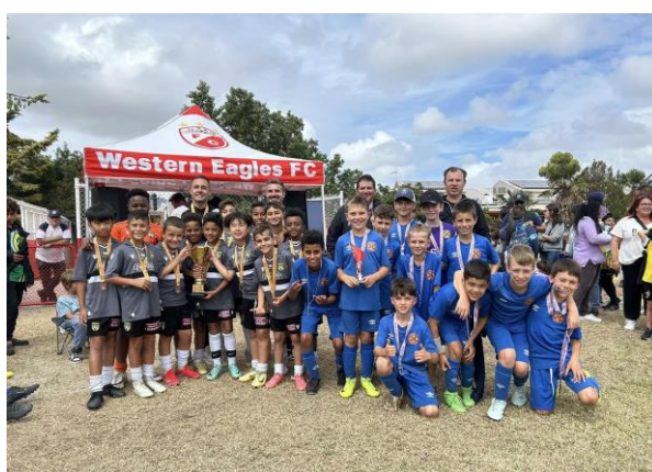
Zawodnicy Brimbank Stallions FC (szare koszulki) i Altona City SC z trenerami

Oprócz piłki nożnej zawodnicy mogli spróbować swoich sił w rozgrywkach brydżowych, tenisie ziemnym, bilardzie, skokach w dal i biegach krótkodystansowych. W trzech pierwszych konkurencjach wzięli udział dorośli zawodnicy, zaś w biegach krótkodystansowych i skoku w dal – dzieci i młodzież.