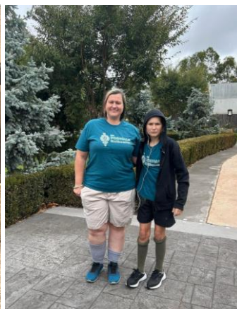
Fot. 1 – Zbiórka przy pomniku Jezusa Miłosiernego w Sanktuarium Miłosierdzia Bożego w Keysborough