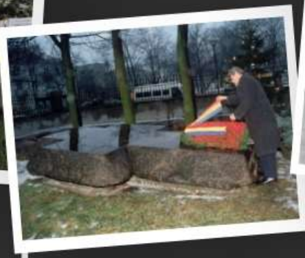
Wizyta Prezydenta Rumunii Emila Constantinescu, styczeń 1997 r.