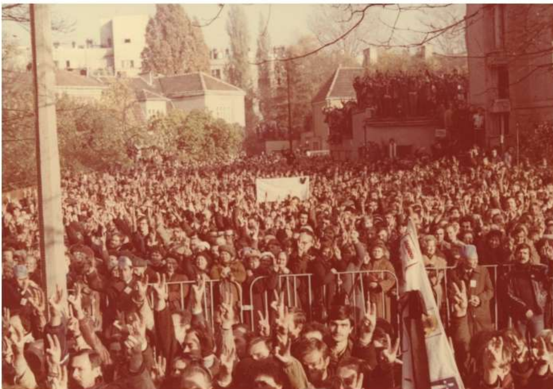
Pogrzeb był religijno-patriotyczną manifestacją. Uczestniczyło w nim około miliona wiernych.

Informacja o porwaniu księdza wywołała narodowy wstrząs. Do żoliborskiego kościoła przybywało tysiące ludzi. Rozpoczęło się wielkie narodowe czuwanie połączone z modlitwą o odnalezienie ks. Jerzego... Jego ciało wydobyto z Wisły 30 października 1984 r., a pogrzeb odbył się 3 listopada. Trumnę z ciałem męczennika złożono do grobu przy kościele, w którym służył przez ostatnie lata życia.