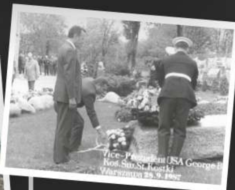
Wizyta późniejszego prezydenta USA Georga Busha, 18 września 1987 r.