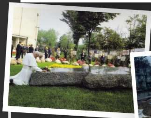
Ojciec Święty Jan Paweł II przy grobie męczennika, 14 czerwca 1987 r.